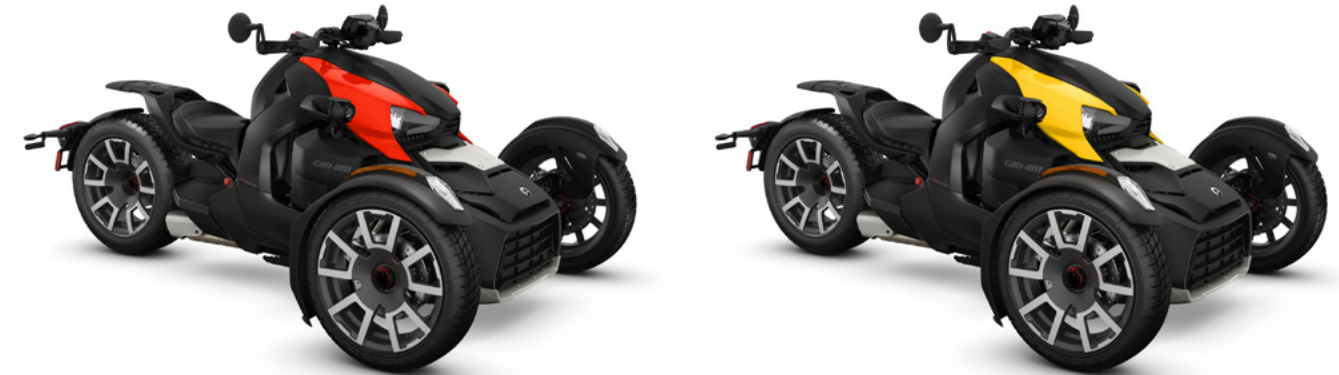
Abb. zeigt Modelle mit Seitenteilen der Classic Serie.